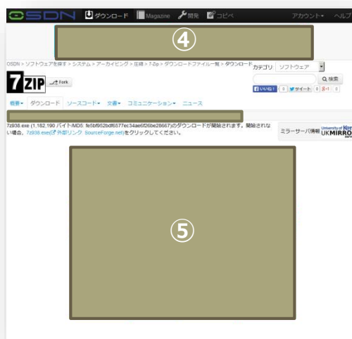
ダウンロード (掲載面)